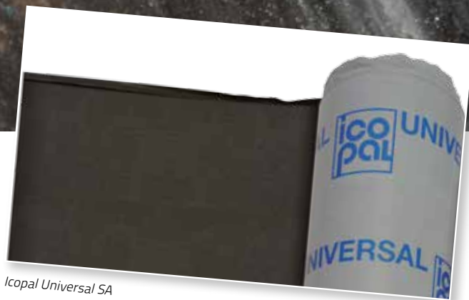
Icopal Universal SA