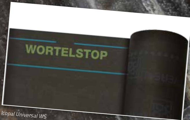
Icopal Universal WS