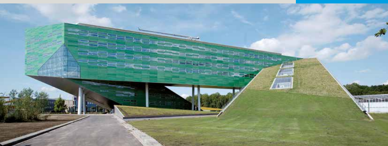
Toepassing van Icopal Universal WS als onderlaag voor een vegetatiedak. Gebouw van de faculteit voor Levenswetenschappen en Dierengeneeskunde op het terrein van de Rijksuniversiteit Groningen.